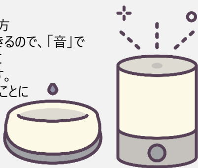
シールに滴下以外にも使えます

■視覚に障害を持っている方 1滴が確実に落とす事ができるので、「音」で精油の量を確認する視覚に障害のある方にも使えます。ドロッパーの問題を解決することによりいままでも不自由に感じておられた方々へ香りを楽しんで頂けるようになりました。