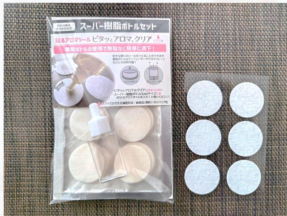
ピタッとアロマ®クリア29φ と滴下専用スーパー樹脂ボ トル(充填なし)セット