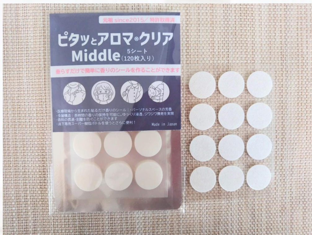
ピタッとアロマ®クリア20φ